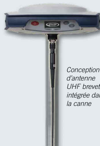
Conception d'antenne UHF brevetée intégrée dans la canne